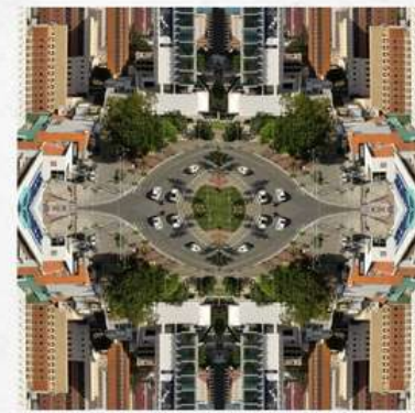
Karine Gallas Fortaleza caleidoscópica