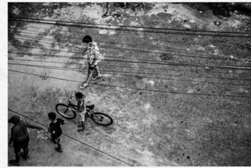
Denise Luz Fim de tarde no bairro